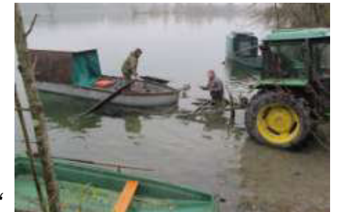
Aktion „Boote vom See“