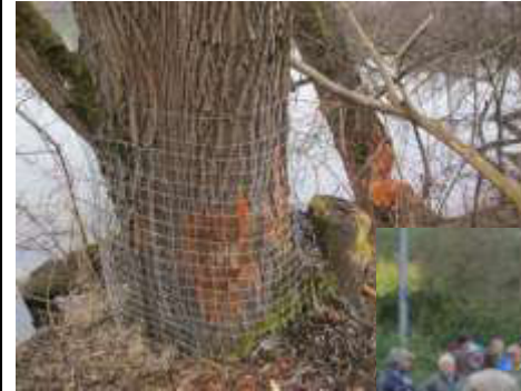
Aktion der Jugendgruppe gegen Biber-Verbiss-Schäden am Weitmannsee