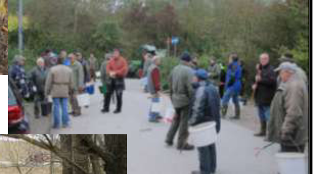
Aktionen „Saubere Umwelt“