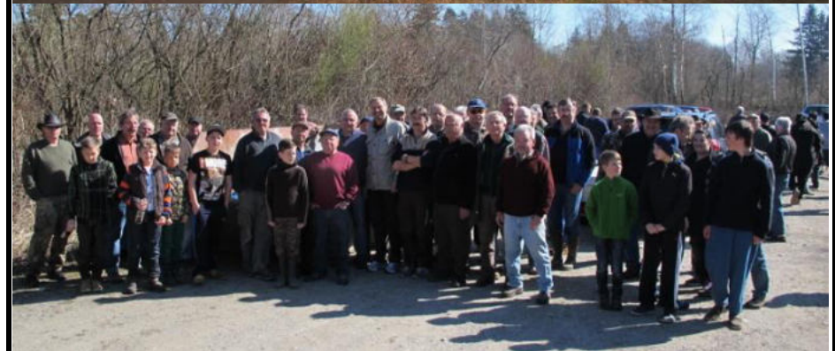
Aktionen „Saubere Umwelt“ im Frühjahr und Herbst