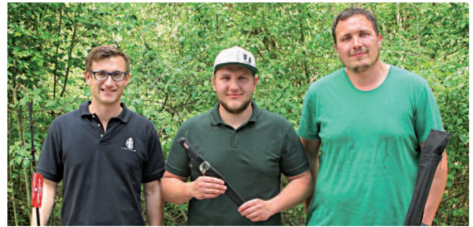
C. Schamberger Forelle, 2380 g