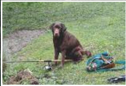
Modell „Emma“ für 1 Angel