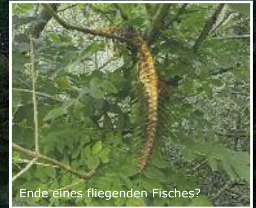
Ende eines fliegenden Fisches?