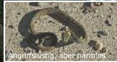
Angriffslustig, aber harmlos