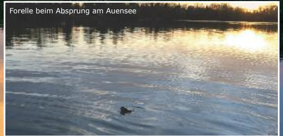
Forelle beim Absprung am Auensee