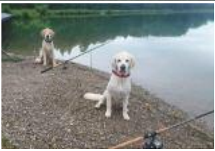
Modell „Arco+Civa“ für 2 Angeln