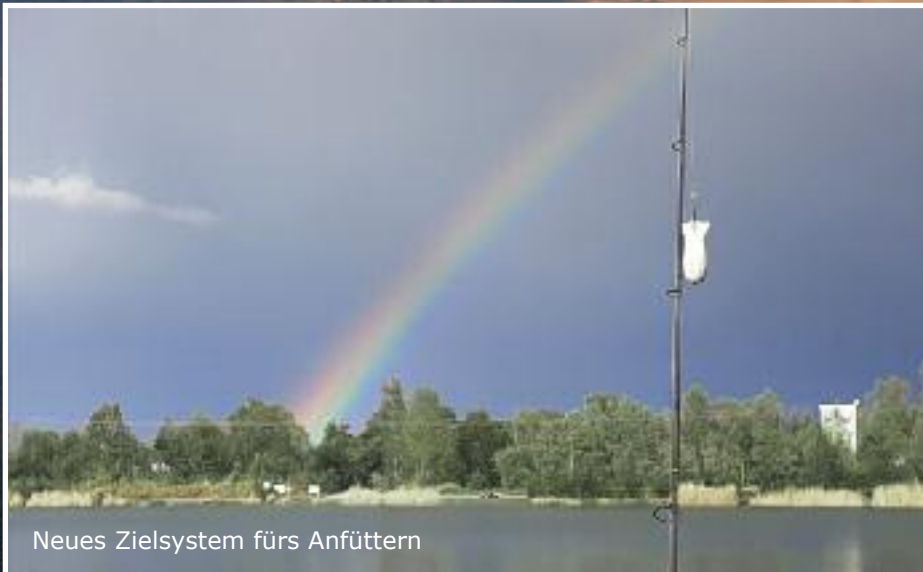
Neues Zielsystem fürs Anfüttern