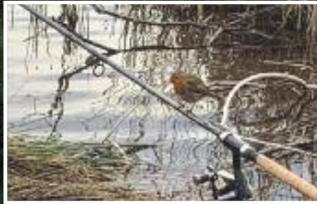
Modell „Birdy“ fürs Feedern