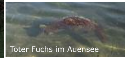
Toter Fuchs im Auensee